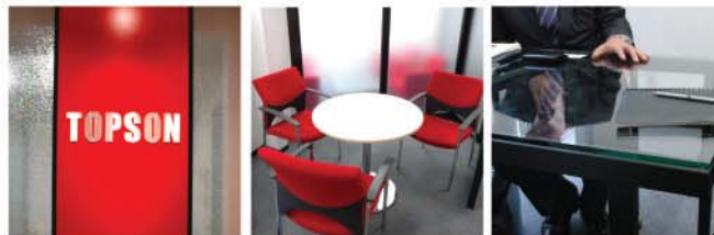
人間重視の姿勢が表れたアメニティ度の高い本社内